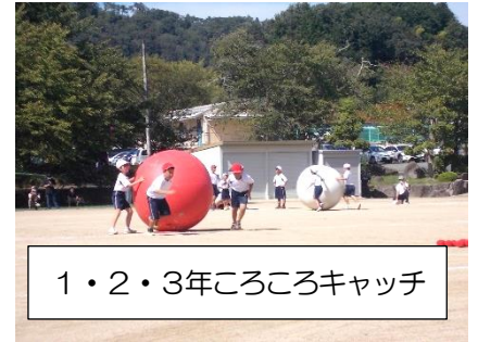
1・2・3年ころころキャッチ