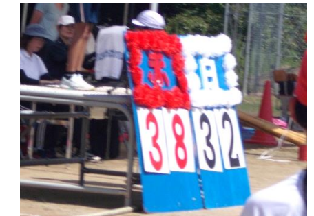
赤白対抗は赤組優勝です