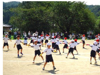
表現 「いのち輝かせ 83の MagicPower!!」